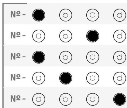
figura 01 - preenchimento CORRETO de cartão-resposta Ensino Fundamental